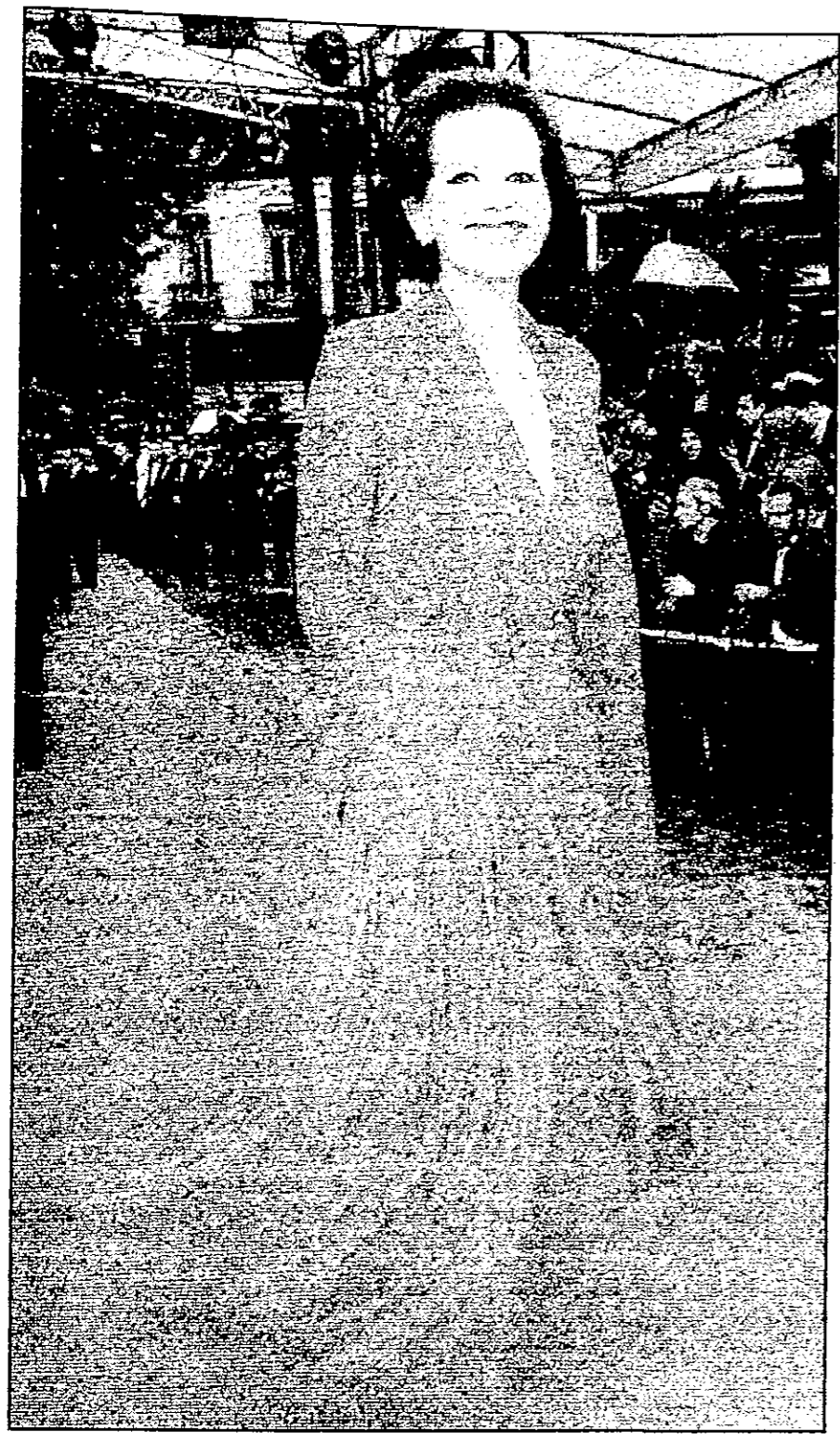
كلوديا كاردينالي والي الميخ مع ابنتها